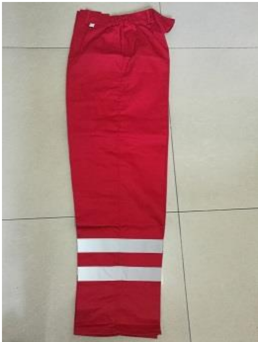
昌平环卫处春秋工作服袖标处: