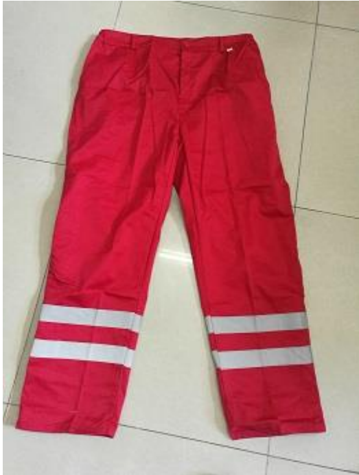
昌平环卫处春秋工作服裤子2: