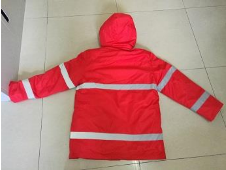
昌平环卫处冬季工作服袖章处：